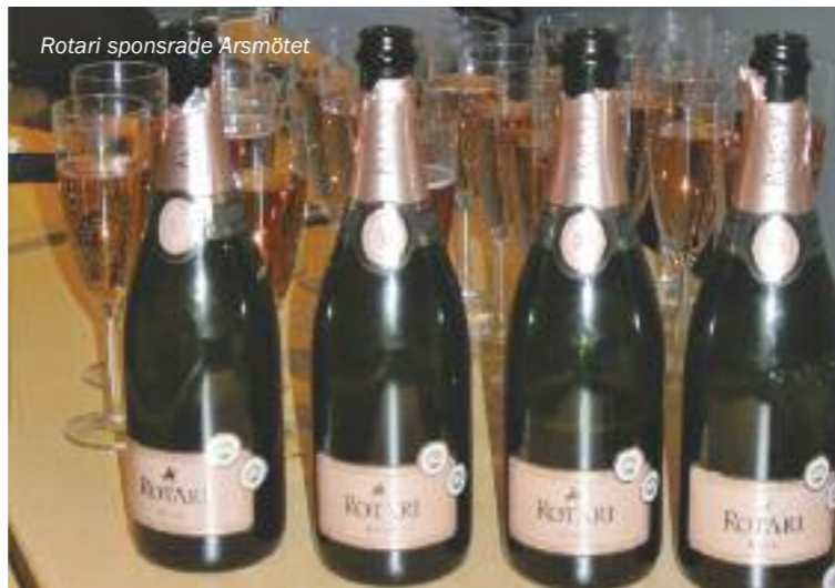
Rotari sponsrade Årsmötet