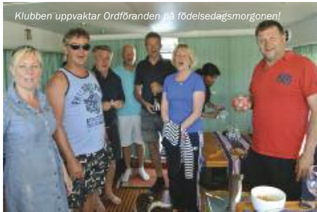
Klubben uppvaktar Ordföranden på födelsedagsmorgonen!