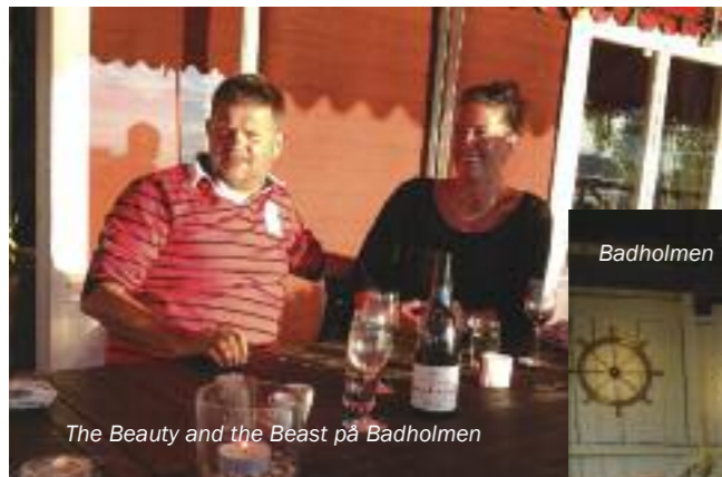
The Beauty and the Beast på Badholmen