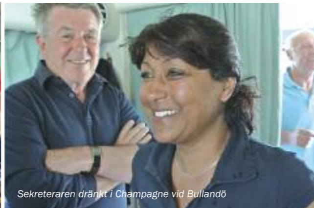
Sekreteraren dränkt i Champagne vid Bullandö

Morgonen efter fick Eskaders medlemmar för sig att de skulle uppvakta den gamle ordföranden på födelsedagen vilket de gjorde med besked och champagne tvärs över Kajsa! Man har nu kommit i den ålder då jag vill minnas att mor min, vid de tillfällen hon tyckte far sa något klyftigt, ofta till talade gubben med "ahhh, det glimmar till i askhögen..." Stort tack, från rörd ordförande!