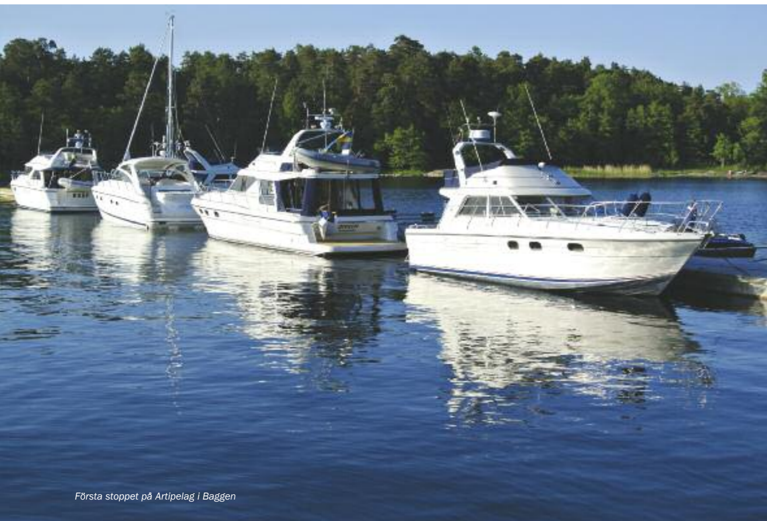
Första stoppet på Artipelag i Baggen

Fortsätt uppför den breda trappan till caféet, släng ett öga eller två in i någon av de stora utställningssalarna och ta nästa trapp upp till restaurangen eller kanske vidare upp på taket för en magnifik utsikt över Baggen.