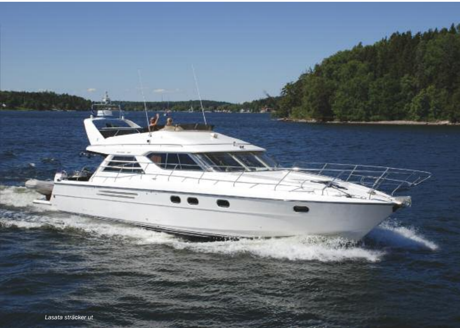
Lasata sträcker ut