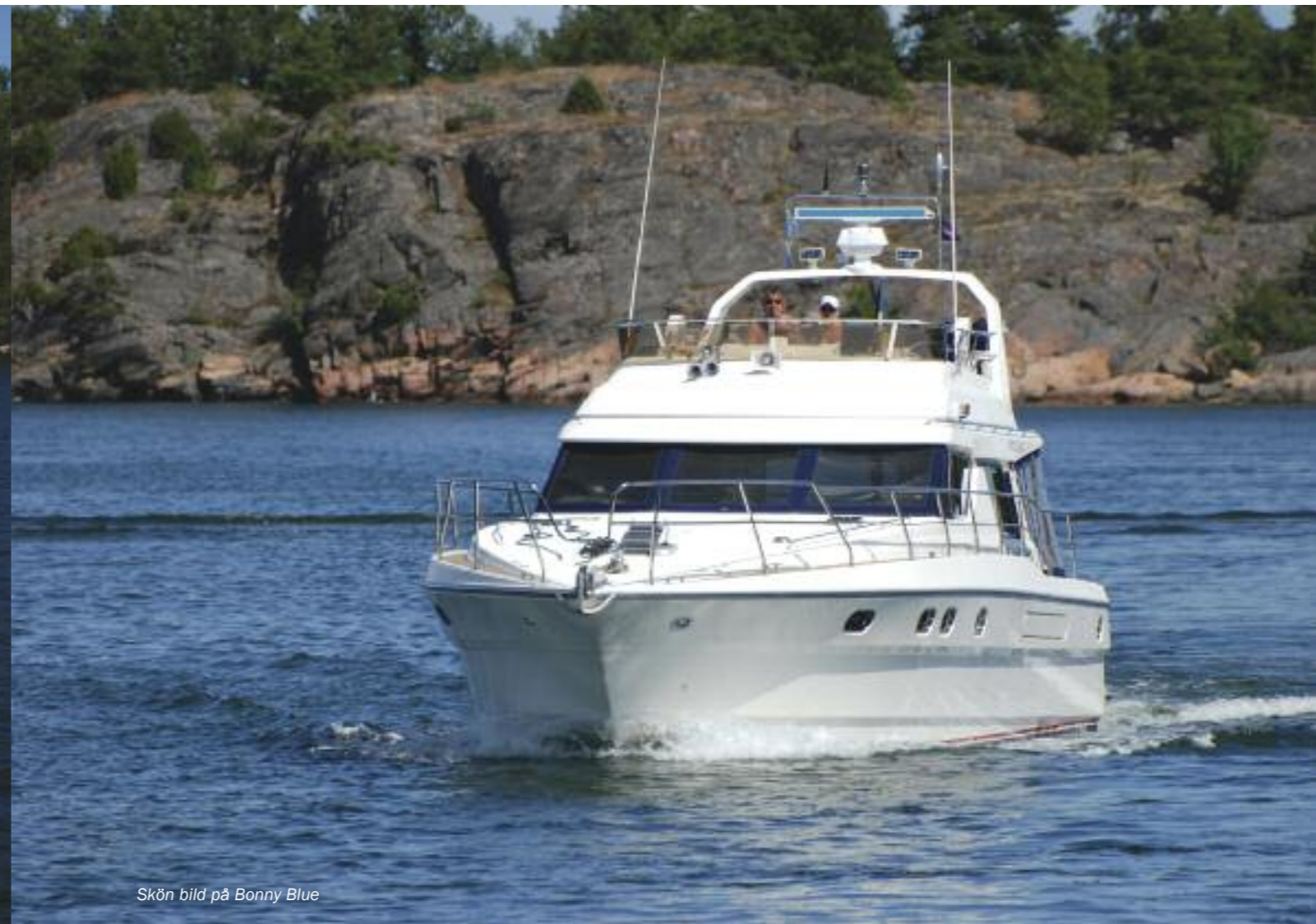
Skön bild på Bonny Blue