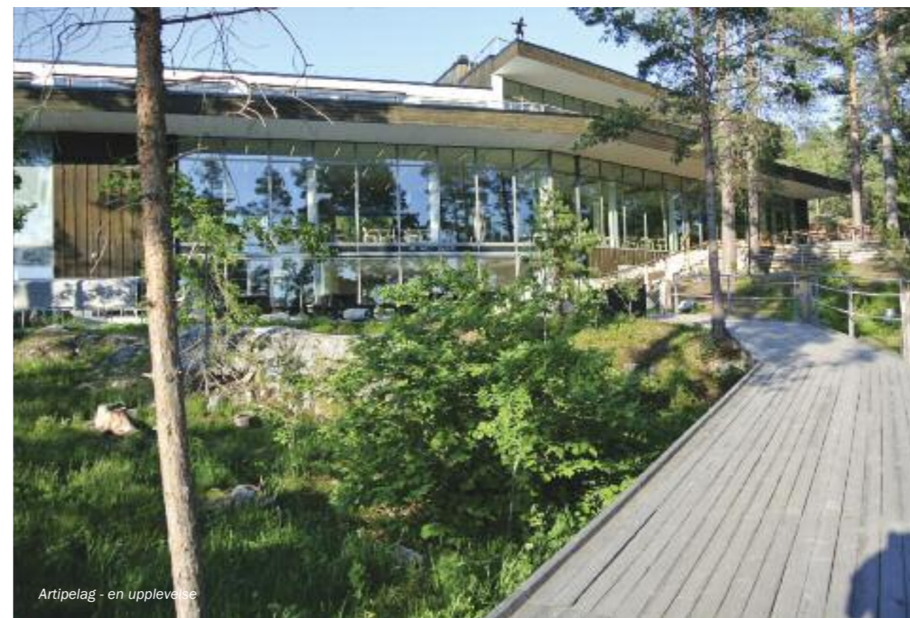
Artipelag - en upplevelse

rekommendera att toalettbesök – men vi är väl ändå som en enda stor-familj.