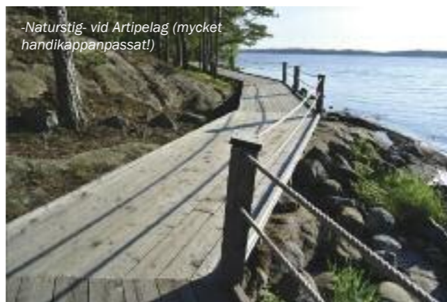
-Naturstig- vid Artipelag (mycket handikappanpassat!)

Anläggningen är i sin tur nästa udda upplevelse. Testa gärna toaletterna (!) på nedersta våningen, när du har varit där förstår du vad jag menar. Det känns lite skruvat att