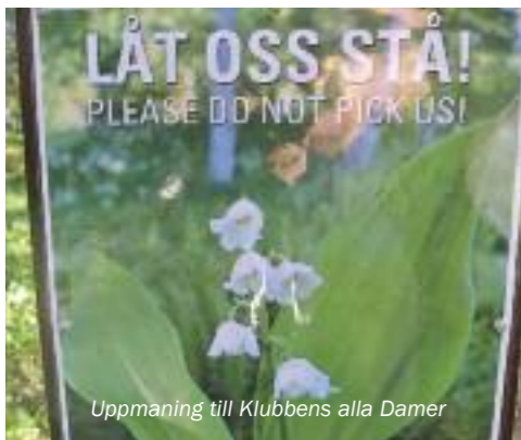
Uppmaning till Klubbens alla Damer