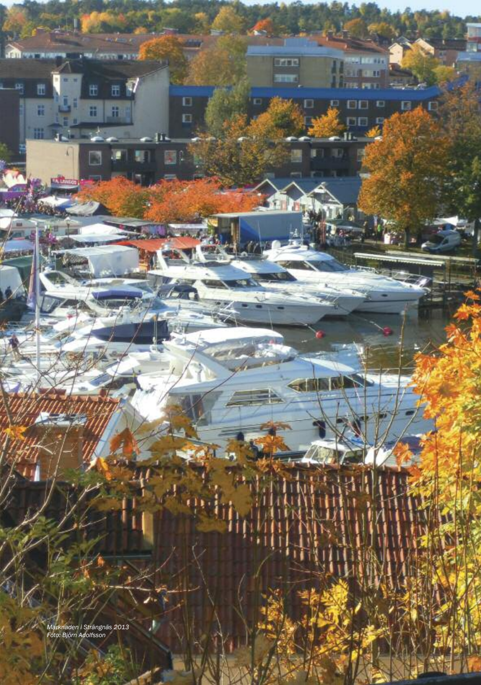
Marknaden i Strängnäs 2013