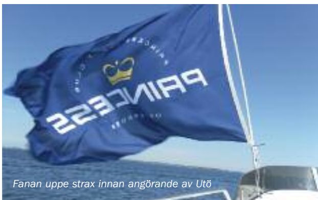
Fanan uppe strax innan angörande av Utö