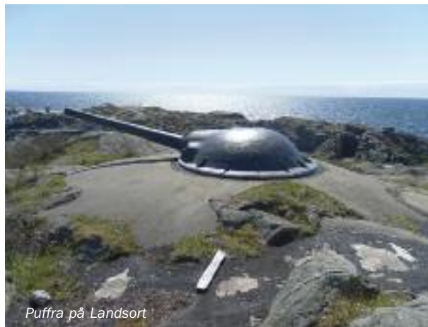
Puffra på Landsort