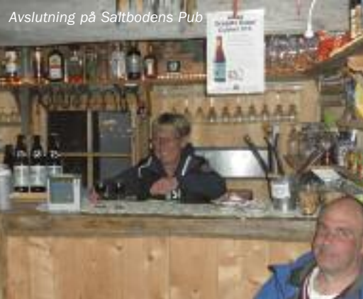
Avslutning på Saltbodens Pub