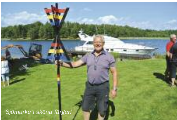
Sjömarke i sköna färger!

Stort Grattis återigen från Princessklubben och som det stod på inbjudan: Tur det inte finns Gubbspärr på motorer!