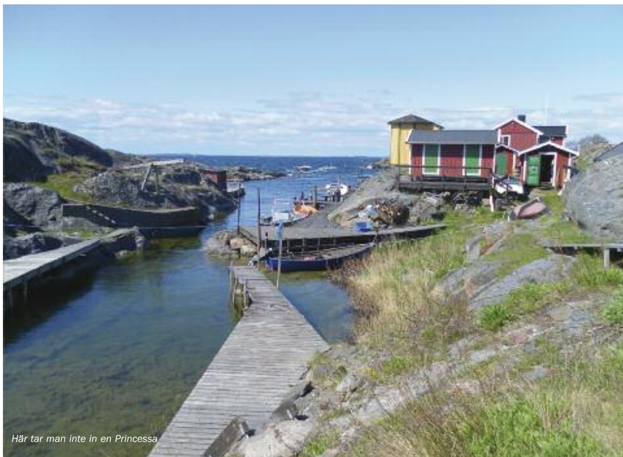
Här tar man inte in en Princessa