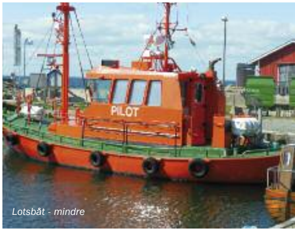
Lotsbåt - mindre