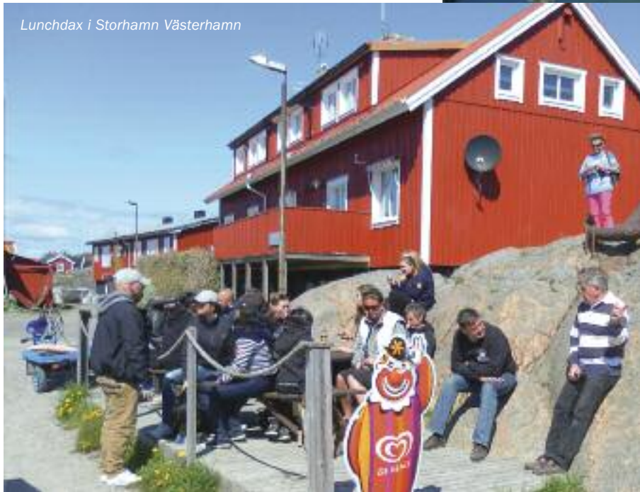
Lunchdax i Storhamn Västerhamn