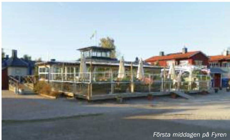
Första middagen på Fyren