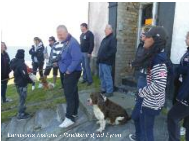
Landsorts historia - föreläsning vid Fyren

Nu var det snart dags att läska våra dammiga skinn vid en vätskekontroll, fast först smög vi omkring lite i skyttevärmen runt fyren och tittade också på artilleripjäsen (15,2 cm kanon m/98B i 15,2 cm tornlav m/1900A, och just där känner jag att jag inte helt begriper vad jag skriver). Själva den numer igenklappade militäranläggningen som underminerar i stort sett allt berg kring fyren ska visst öppnas för viss visning till sommaren, så där var vi lite för tidiga. Här hittade vi dock de första av en hel dröse förbudsskyltar, Landsort = Förbudsskyltarnas ö! På statens Fastighetsverks hemsida kan man läsa lite om öns färsk historia tex att Landsort är mycket mer än en fyr och ett namn i sjörapporten. Här hittar du ett fyrvåningshus av stål inuti berget, dimensionerat för ett underjordiskt samhälle och konstruerat för att stå emot ett kärnvapenangrepp. Fram