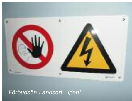
Förbudsön Landsort - igen!