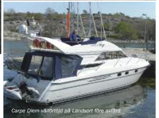
Carpe Diem välförtöjd på Landsort före avfärd