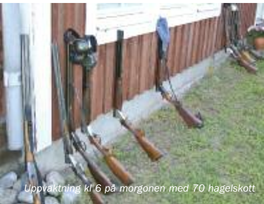
Uppvaktning kl 6 på morgonen med 70 hagelskott