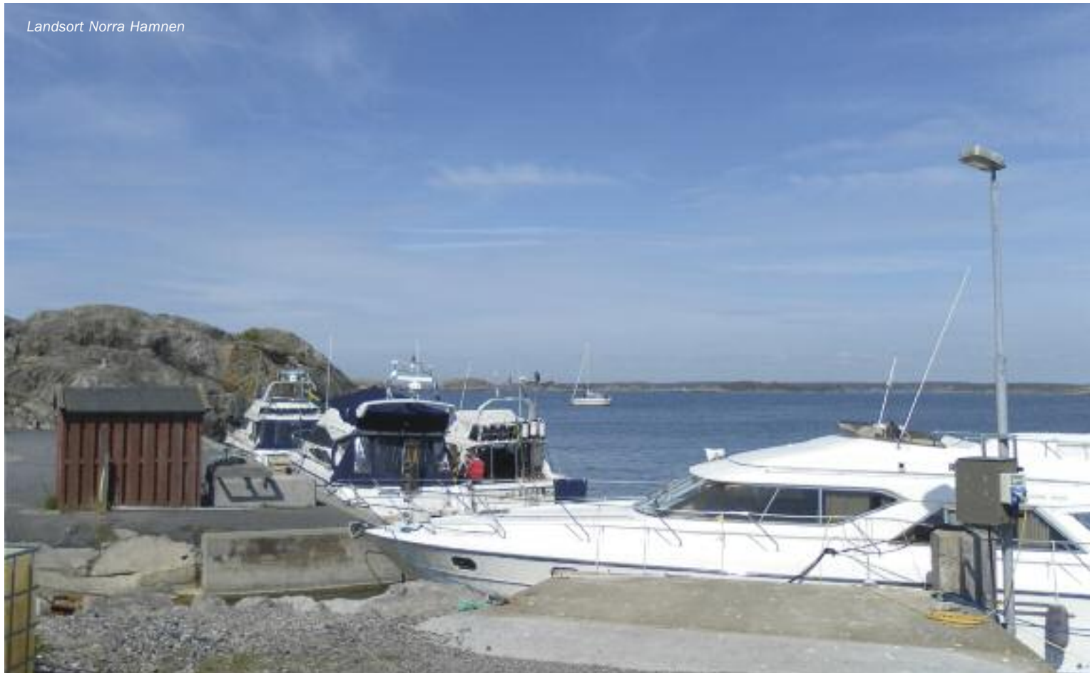
Landsort Norra Hamnen

12 - 16 personer om man är mycket nära släkt, nykär eller är i total avsaknad av luktsinne. Rekommenderas!