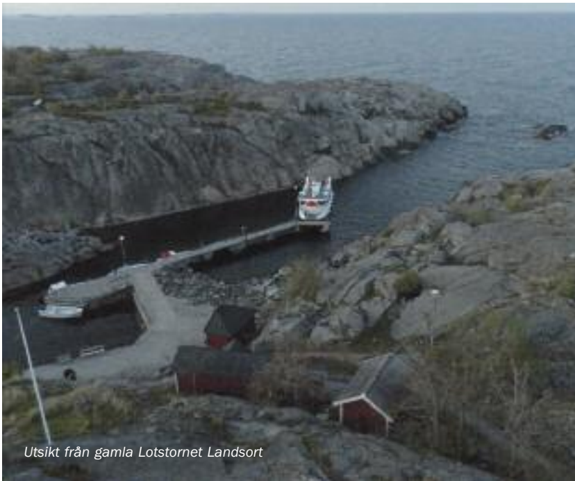
Utsikt från gamla Lotstornet Landsort