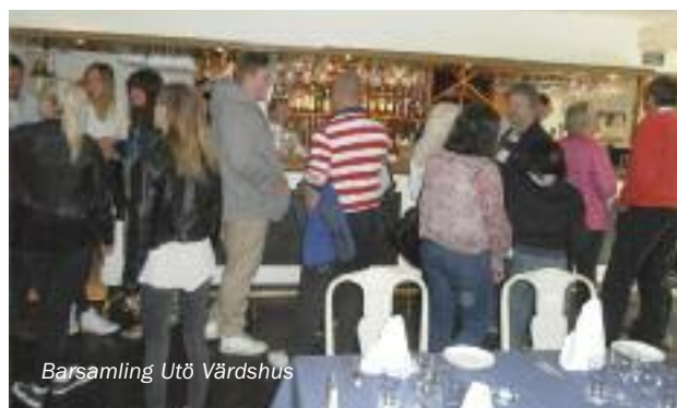
Barsamling Utö Vårdshus

Kvällen avnjöts på Utö Vårdshus under sedvanlig ordning, men mat och dryck var i god ordning och uppskattad av