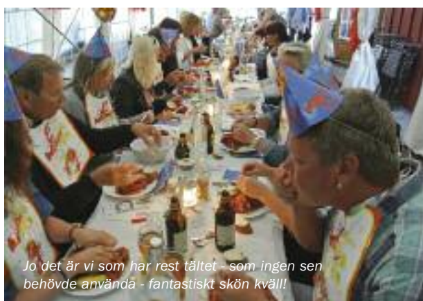
Jo det är vi som har rest tältet - som ingen sen behövde använda - fantastiskt skön kväll!