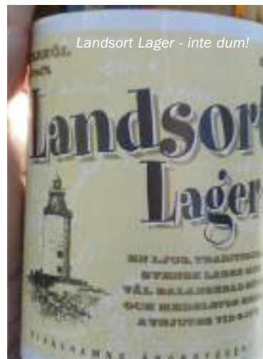
Landsort Lager - inte dum!

förstås så han fick trampa runt med punka på grusvägarna.