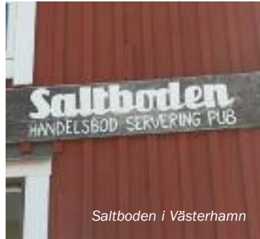
Saltboden i Västerhamn