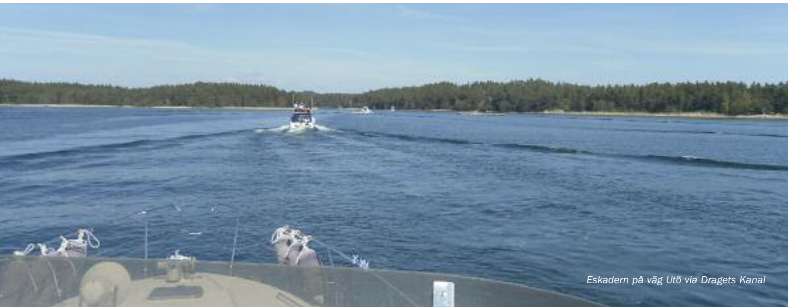
Eskadern på väg Utö via Dragets Kanal