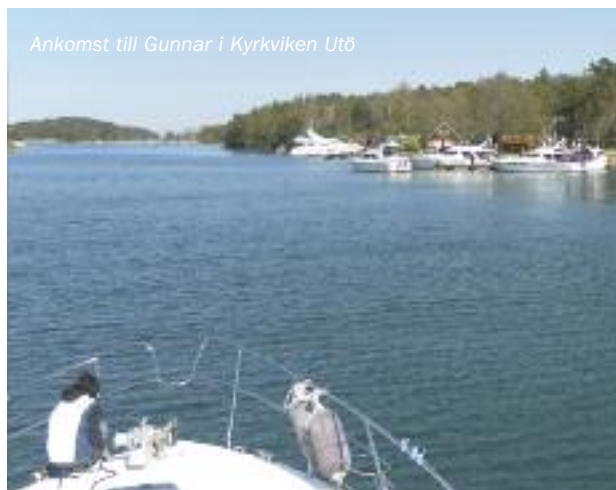
Ankomst till Gunnar i Kyrkviken Utö

Sanduddens Yacht Club (!) i Kyrkviken! Fint ska det vara. Här möts man efter platsanvisning av ett familjärt välkom-