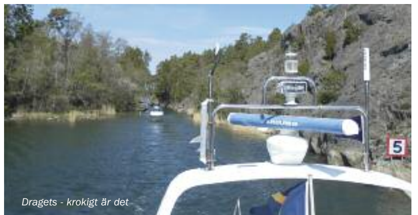
Dragets - krokigt är det