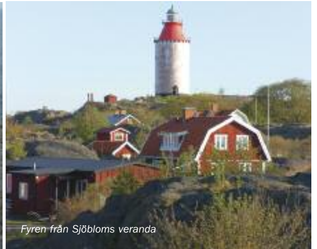
Fyren från Sjöbloms veranda