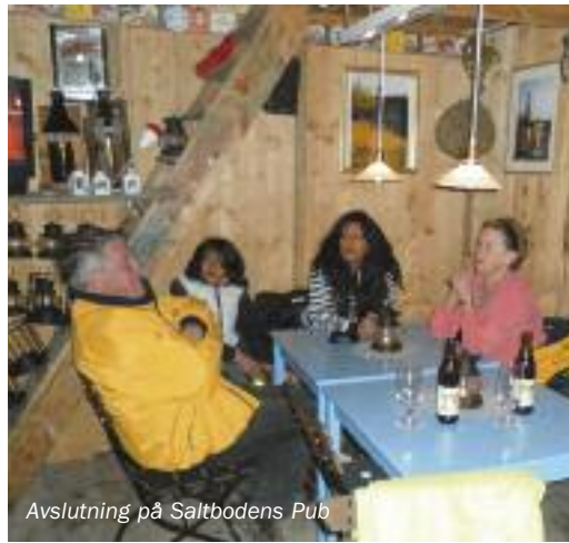
Avslutning på Saltbodens Pub